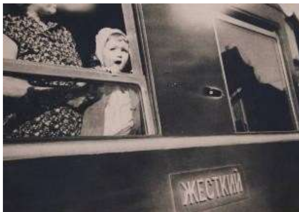
Ja siis sõitsime kaugete kohe - Raplasse

Nii allkirjastas minu isa albumis selle pildi. Tänapäeval kõlab see lause ehk kuidagi kummaliselt, kuid 1959.aastal oli sõit Tallinnast Raplasse kitsarööpmelisel ühe 1,5-aastase lapse jaoks tõesti pikk ja kaugeltki mitte igapäevane reis.